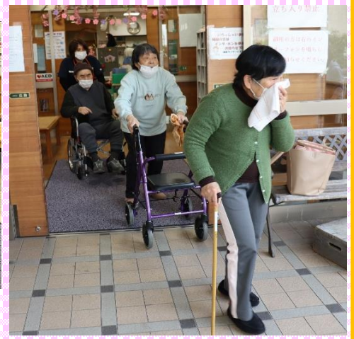
煙を吸わないように、外へ。