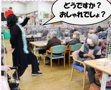
どうですか？ おしゃれでしょ？