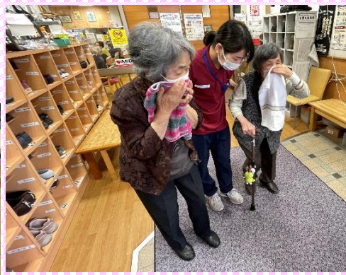
転倒しないように 素早く避難します。