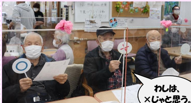
わしは、 ×じゃと思う。

今年の雑祭りは 一味違います！！ 雑祭りに関する ○×クイズとともに 職員による ファッションショー を開いてみました！！