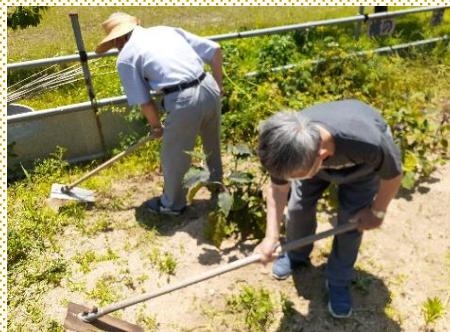
※感染対策には十分注意します。