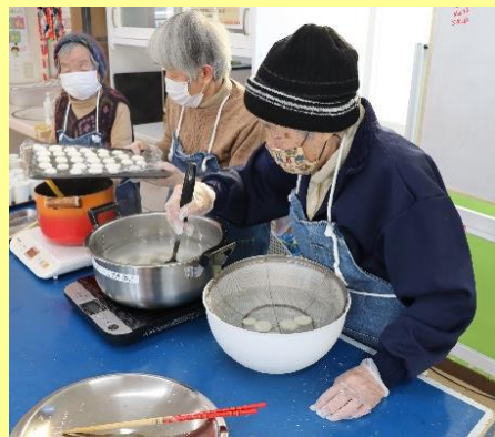
白玉を茹でる作業