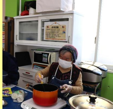
つぶあんを溶かす作業