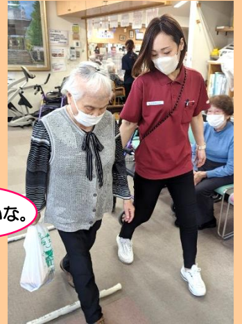
買い物後を想定しての歩行訓練