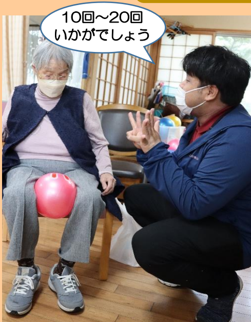
自宅で出来る 自主トレのご指導