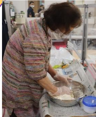
生地から作りました