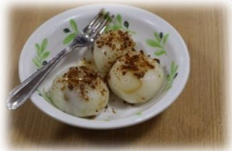
モンローンイエイボン