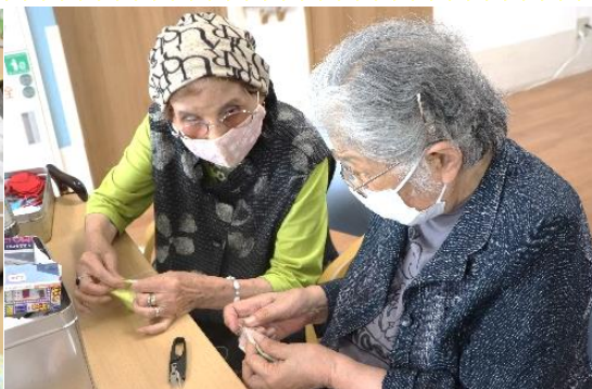
最後に口を縫ったら完成！