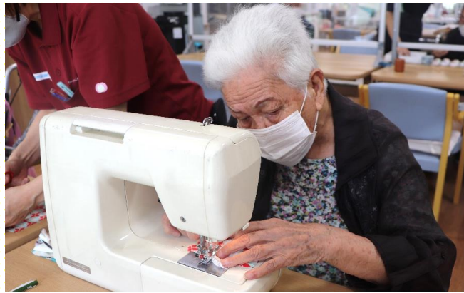
ミシンで裁縫します。