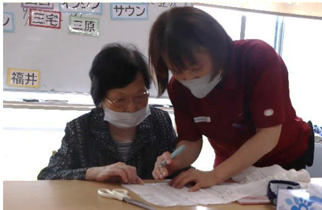
布に線を引いていきます。

今回は隣接しているつぼみケア(児童発達支援放課後等デイサービス)から、運動会でお手玉を使用したいという依頼があり、ご利用者様と一緒に作成しました。『こども達のために』というやりがいを持てるよう作成活動に取り組みました。