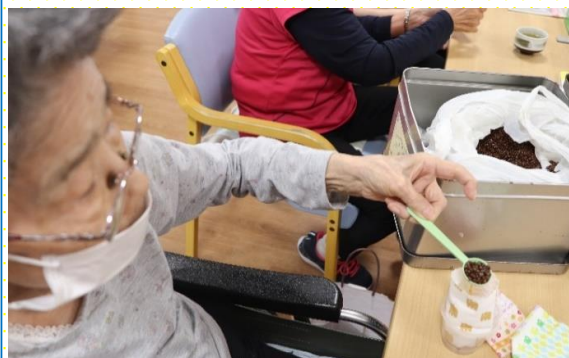
できた袋に中身を入れていきます。