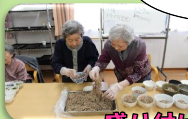
盛り付け・タオルたたみ