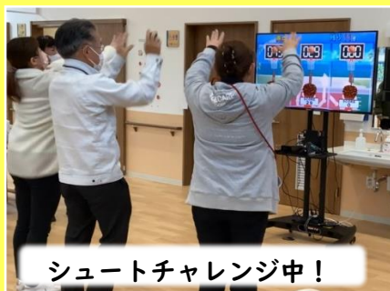
シュートチャレンジ中！