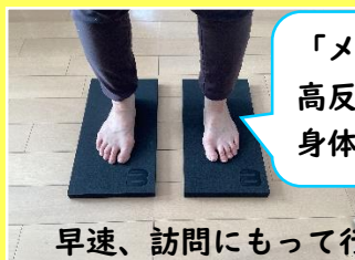
「メトリクスフォーム」 高反発素材のマットが 身体感覚を刺激