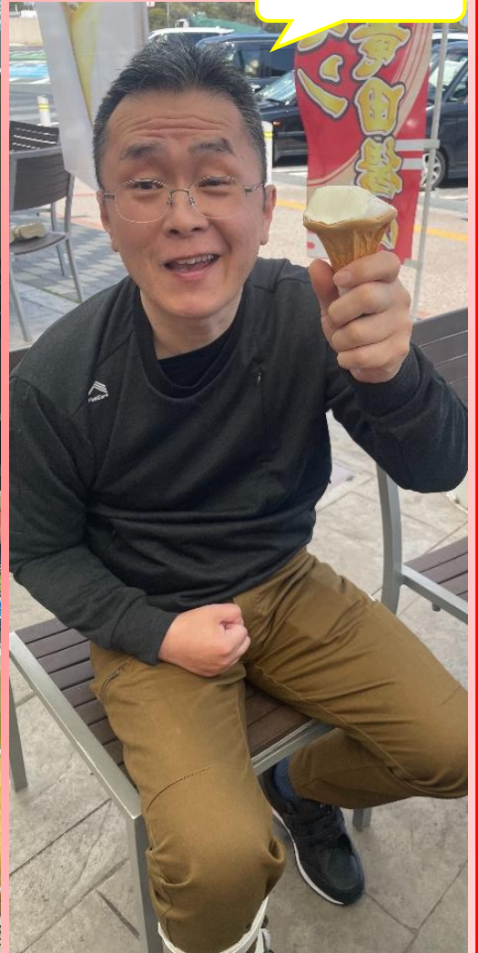
アイスを食べました♪